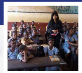
Besuch einer Schule während einer Reise im Januar 2017 nach Conakry.